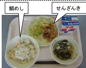
(例) 愛媛の郷土料理